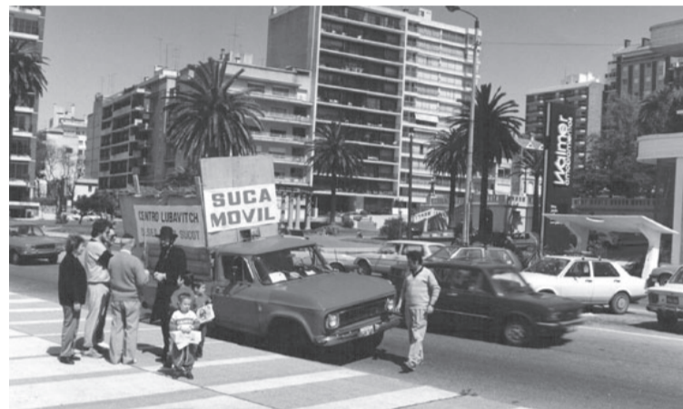
Sucá móvil hace 10 años