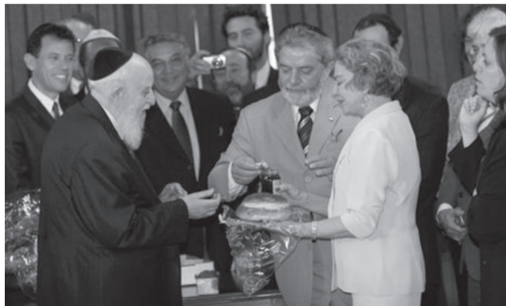
El presidente Lula da Silva repartiendo manzana con miel, en ocasión de una celebración de Rosh Hashana

«Como saldo de esta reflexión -tan parecida a los días entre Rosh Hashana y Yom Kipur- comienza a surgir un nuevo consenso de que las naciones deben privilegiar la justicia social y la distribución de la renta en vez de estimular la ganancia y el individualismo», continuó Lula.