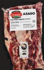
CORTES DE CARNE VACUNA

Encontralos en: Macro Mercado, Disco, Devoto, Geant y Tienda Inglesa