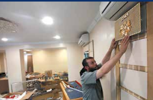
El centro de Jabad de Mumbai reabre 6 años después de los atentados de 2008