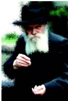
Foto de tapa: El Rebe de Lubavitch ofreciendo una moneda para Tzedaká.

Kesher Pulbicación de Beit Jabad Uruguay. Avda. Brasil 2704, 11300, Montevideo, Uruguay Telefax: (5982) 709 3444 E-mail: kesher@adinet.com.uy