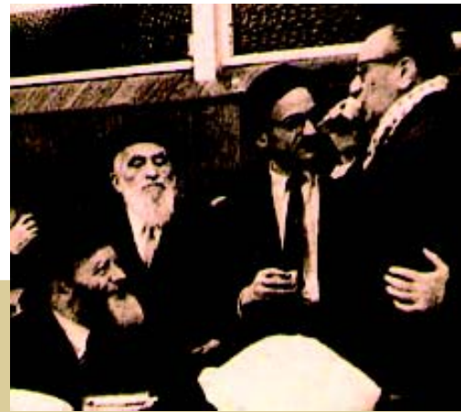
Elie Wiesel junto al Rebe en un encuentro mantenido en los años 60.

La biblioteca y archivo centrales de Agudat Jasidei Jabad Lubavitch, en el Centro Mundial Lubavitch, es una de las más preciadas reservas de libros y literatura judía, con una fabulosa colección de libros y manuscritos únicos.