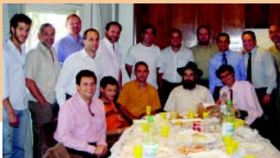
Grupo de asistentes a "Luch & Learn", que se realiza mensualmente en el estudio Bergstein.