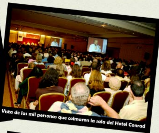
Vista de las mil personas que colmaron la sala del Hotel Conrad