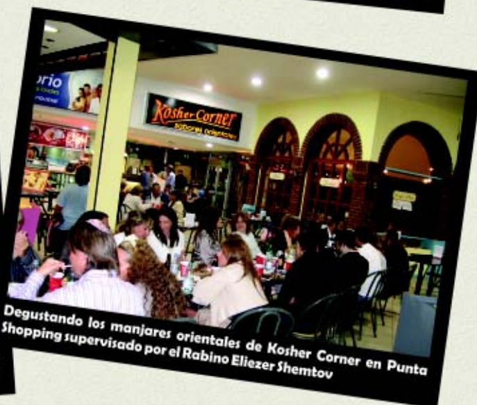
Degustando los manjares orientales de Kosher Corner en Punta Shopping supervisado por el Rabino Eliezer Shemtov