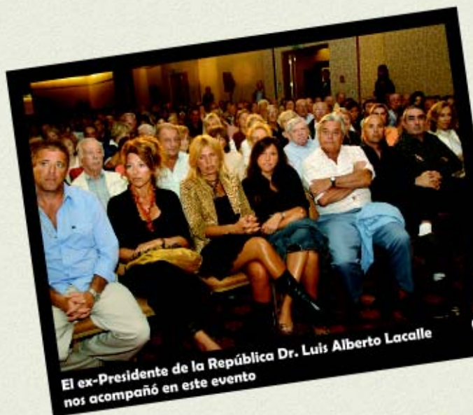
El ex-Presidente de la República Dr. Luis Alberto Lacalle nos acompañó en este evento