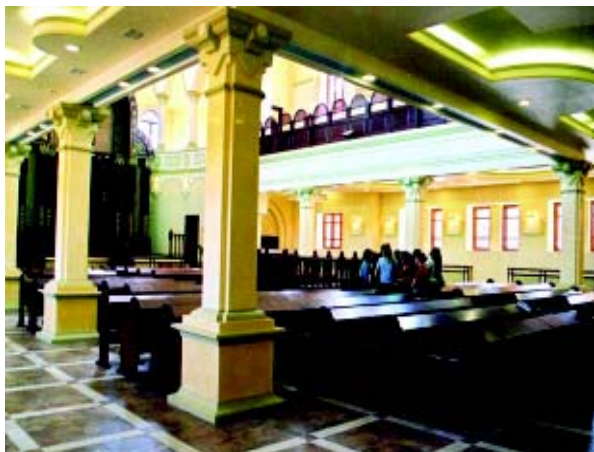
Interior de la Sinagoga actual de Jabad en Kharkov

Un día un hombre anciano entró en el shil .