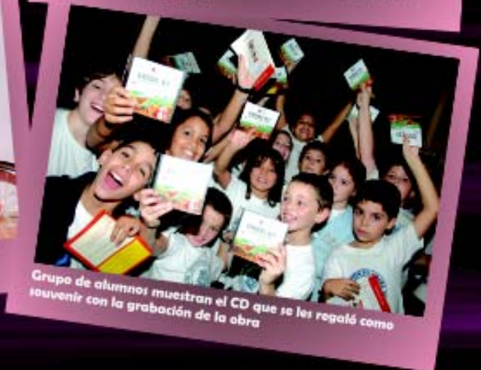
Grupo de alumnos muestran el CD que se les regaló como souvenir con la grabación de la obra