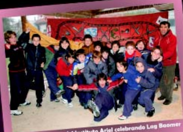
Grupo de alumnos del Instituto Ariel celebrando Lag Baomer