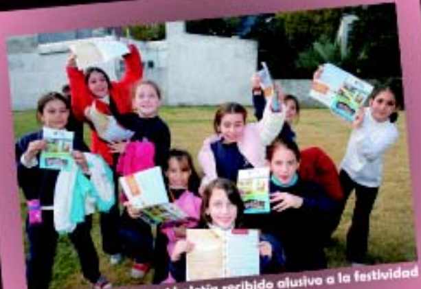
Los chicos muestran el boletín recibido alusivo a la festividad