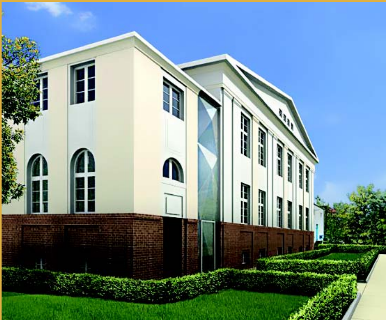
Centro de Educación Judía de Jabad - Szloma Albaum Haus, Rohr Chabad Center (Berlín)