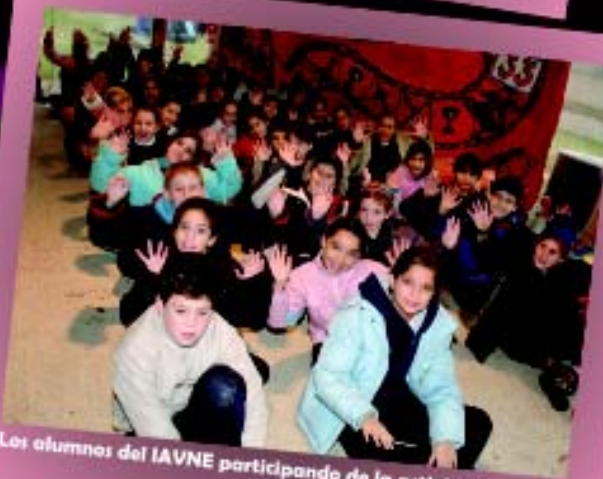
Los alumnos del IAVNE participando de la actividad