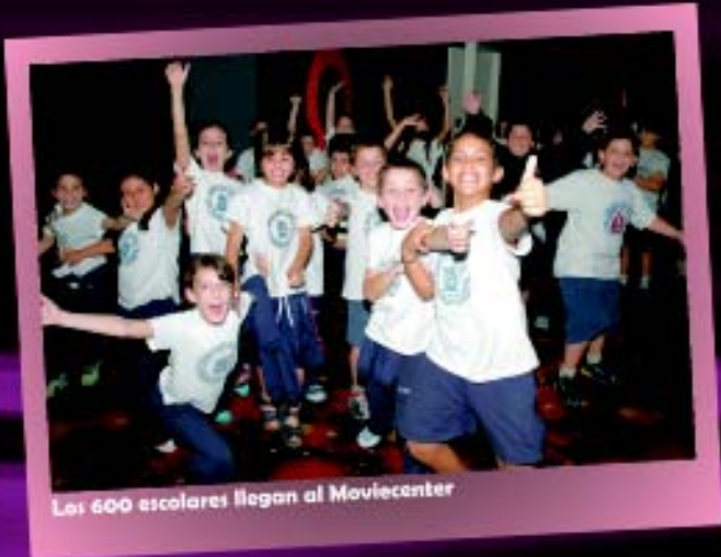
Los 600 escolares llegan al Moviecenter