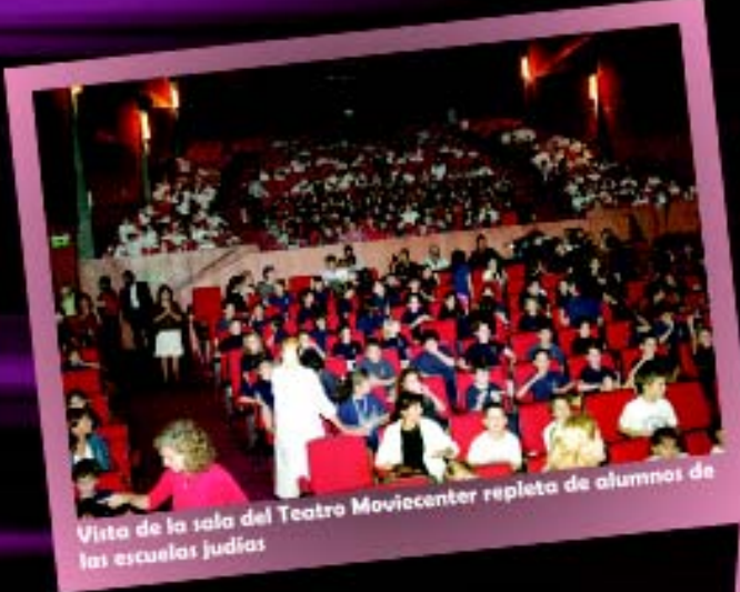
Vista de la sala del Teatro Moviecenter repleta de alumnos de las escuelas judías