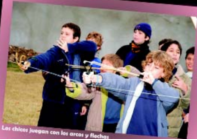
Los chicos juegan con los arcos y flechas