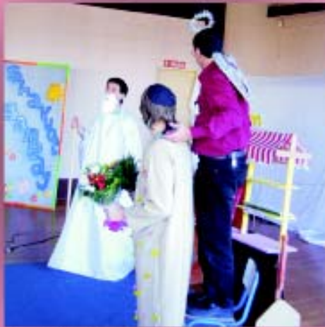
Escena de la obra de teatro "MacTorá"