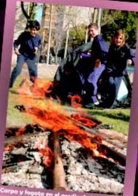
Carpa y fogata en el predio de Jabad conmemorando Lag Baomer