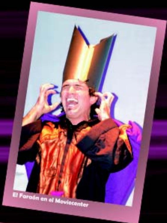
El Faraón en el Moviecenter