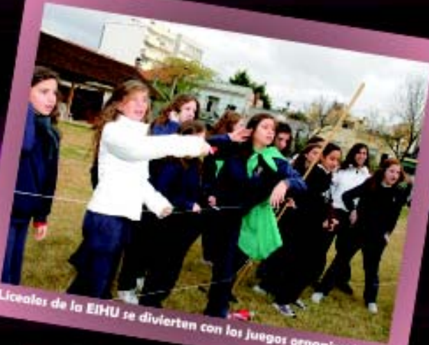
Liceales de la EIHU se divierten con los juegos organizados