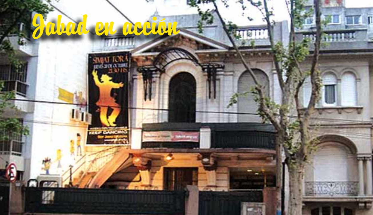
Preparándose para Simjat Torá.