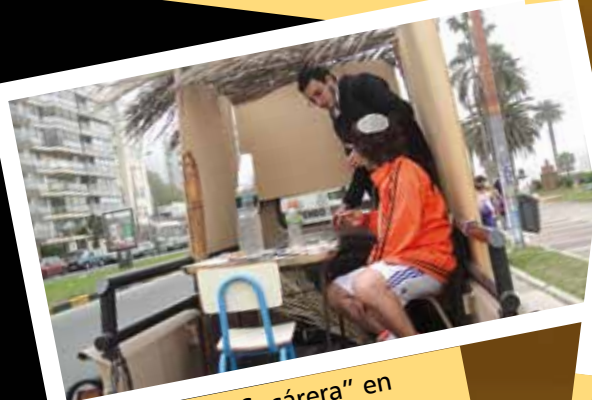
Hospitalidad "Sucáera" en la Rambla de Pocitos.