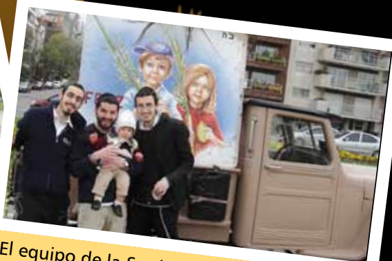
El equipo de la Sucá Móvil.