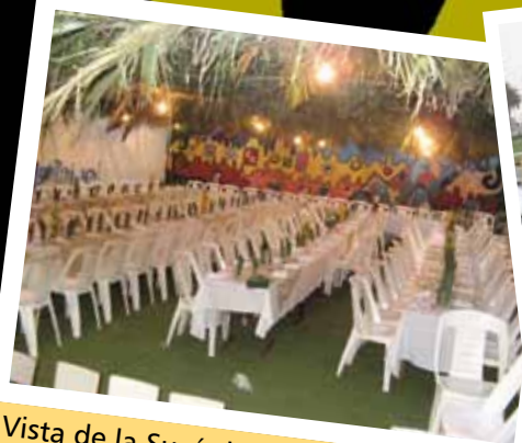
Vista de la Sucá de Beit Jabad en vísperas de la fiesta.